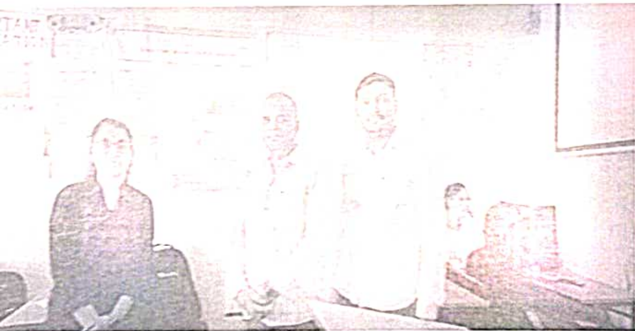
Number Prize Awarded Poster on title of "To Improve Quality and Quantity of Yield Using Agrotechnology"