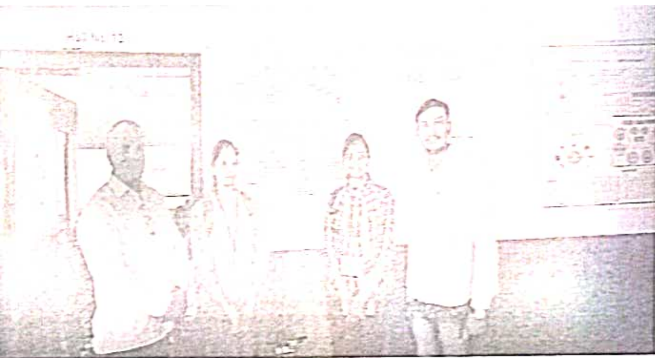
Poster Presentation on title of "Cultivation of Spiraling as non protein source".